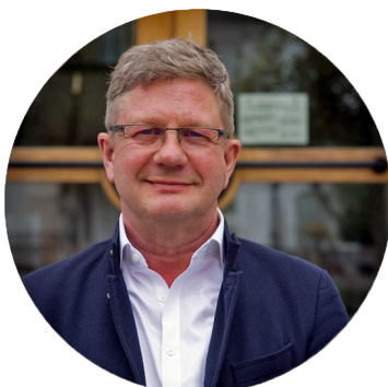
Josef Niedermeier, Erster Bürgermeister der Gemeinde Pfaffing, Landkreis Rosenheim