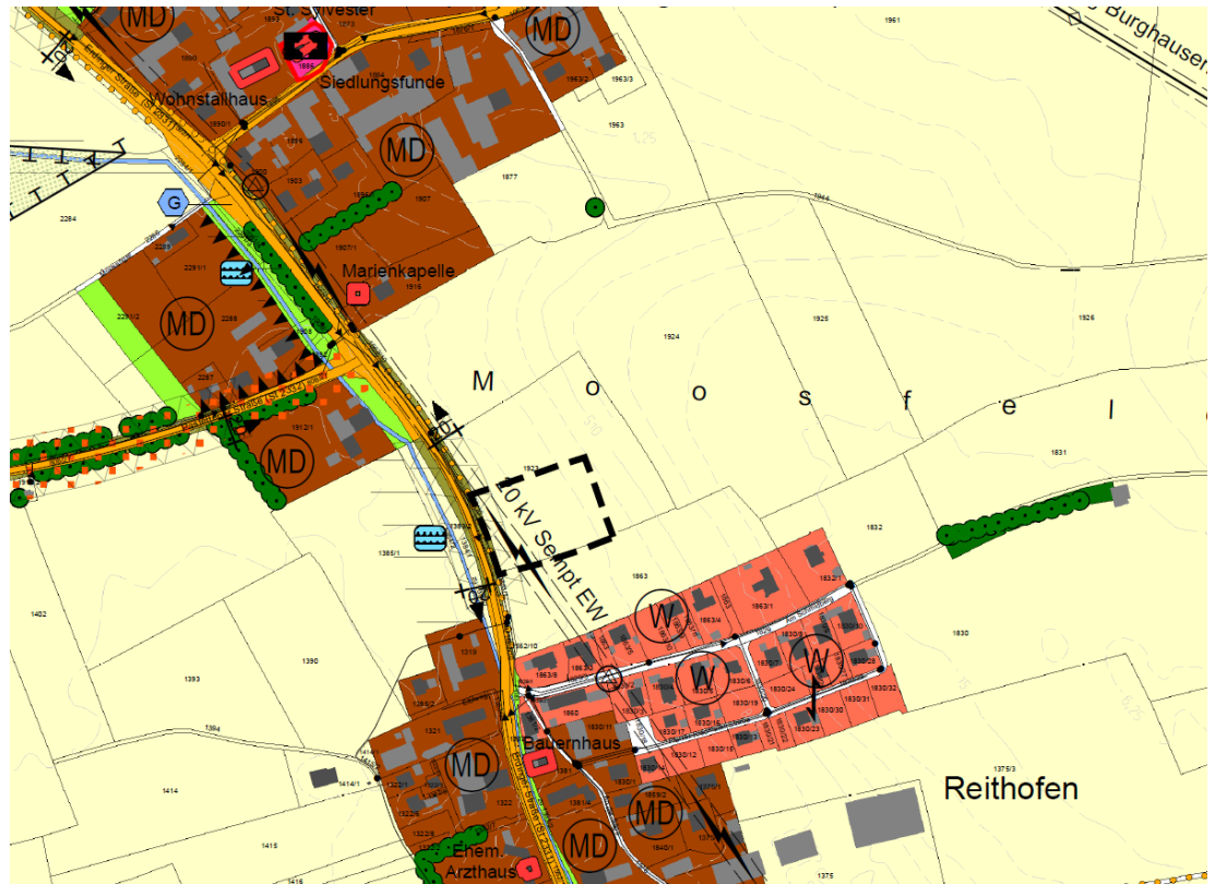
Abb. 3 Ausschnitt des Änderungsbereiches 2 aus dem wirksamen FNP mit Lage der 01.Änderung, ohne Maßstab