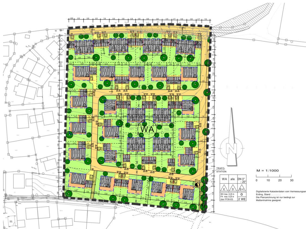
Abb. 2 Ausschnitt aus dem wirksamen Bebauungsplan ohne Maßstab