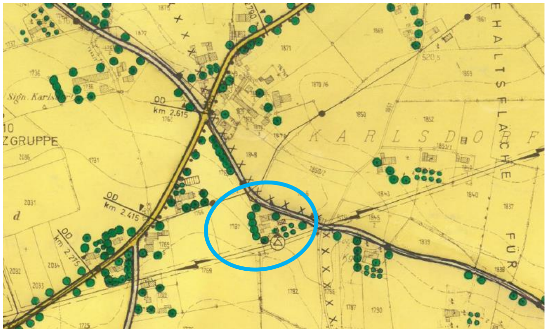
Abbildung: Ausschnitt rechtswirksamer FNP mit blauer Umrandung des Plangebietes

Die 9. Änderung des Flächennutzungsplans stellt den westlichen Teil des Plangebietes als Allgemeines Wohngebiet und den östlichen Teil weiterhin als Fläche für die Landwirtschaft mit einer Hofstelle im Außenbereich dar. Zwischen den Teilbereichen sowie südlich des Allgemeinen Wohngebietes liegt ein Grünstreifen für Gehölzpflanzungen. An der Südgrenze des Plangebietes verläuft eine 20 kV-Freileitung