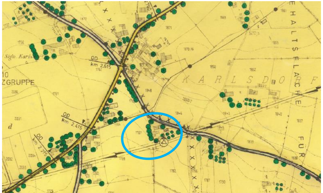
Abbildung: Ausschnitt rechtswirksamer FNP mit blauer Umrandung des Plangebietes

Die 9. Änderung des Flächennutzungsplans stellt den westlichen Teil des Plangebietes als Allgemeines Wohngebiet und den östlichen Teil weiterhin als Fläche für die Landwirtschaft mit einer Hofstelle im Außenbereich dar. Zwischen den Teilbereichen sowie südlich des Allgemeinen Wohngebietes liegt ein Grünstreifen für Gehölzpflanzungen. An der Südgrenze des Plangebietes verläuft eine 20 kV-Freileitung