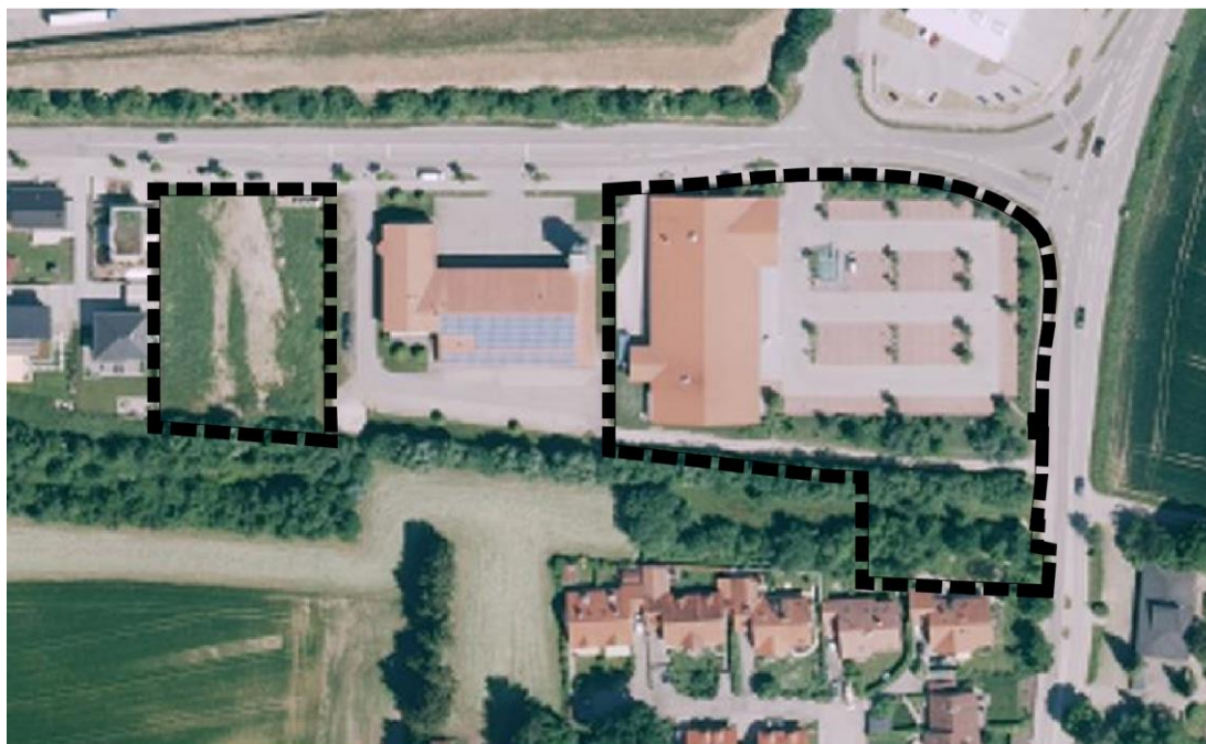
Abb. 3: Luftbild des Plangebiets mit Geltungsbereich (schwarze Umrandung), (Geobasisdaten © Bayerische Vermessungsverwaltung 2015)

Im Geltungsbereich des Bebauungsplans sind keine Schutzgebiete nach dem Bundesnaturschutzgesetz ausgewiesen.