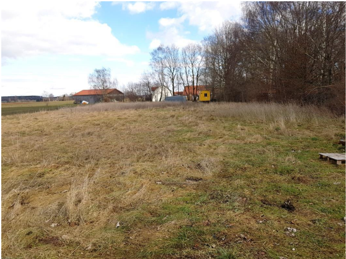
Abbildung 1: Blick Richtung Osten auf das Plangebiet am 17.02.2021

Ein Großteil der gegenständlichen Planfläche liegt derzeit brach. Der Brachfläche ging in der Vergangenheit eine landwirtschaftlich genutzte Fläche voraus.