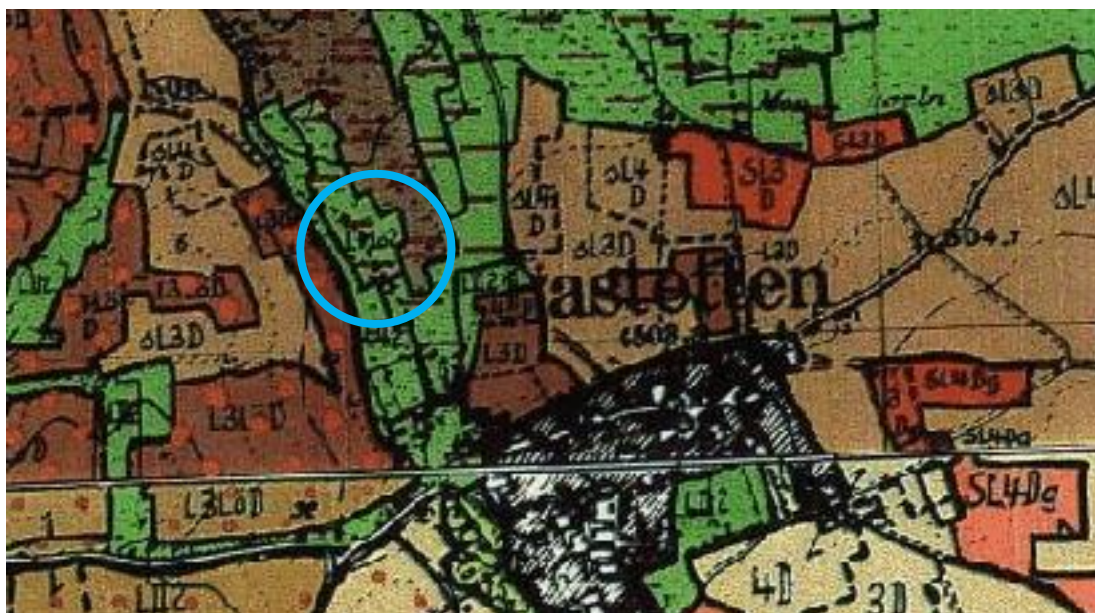
Abbildung 3: Ausschnitt Bodenschätzungs-Übersichtskarte von Bayern 1:25.000, Pastetten Geobasisdaten: © 2017 Bayerische Vermessungsverwaltung und GeoBasis-DE / Bundesamt für Kartographie und Geodäsie (BKG), Fachdaten: © Bayerisches Landesamt für Umwelt

Hintergrundkarten: © Bayerische Vermessungsverwaltung, Bundesamt für Kartographie und Geodäsie, Bayerisches Landesamt für Umwelt, GeoBasis-DE / BKG, EuroGeographics, CORINE Land Cover