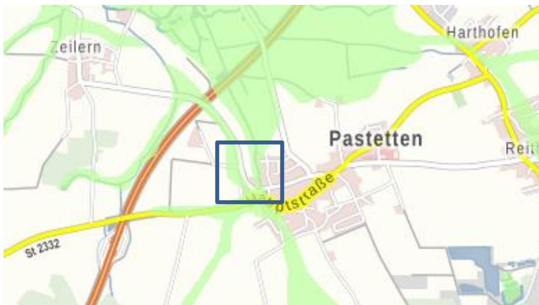
Abbildung 4: Ausschnitt Informationsdienst Überschwemmungsgefährdete Gebiete

Darüber hinaus traten in der Vergangenheit historische Hochwasserereignisse auf, welche gemäß Umweltatlas als Überschwemmungsflächen gekennzeichnet sind und u.a. das gesamte Planungsgebiet betreffen. Das Ufer des Kultnergrabens ist zwar nördlich des geplanten Baugebiets unverbaut, aber eingetieft, so dass der Bach und die Aue nur noch sehr eingeschränkt eine intakte funktionelle Einheit bilden. Das zuletzt zurückliegende Hochwasserereignis trat im Jahr 2013 auf.