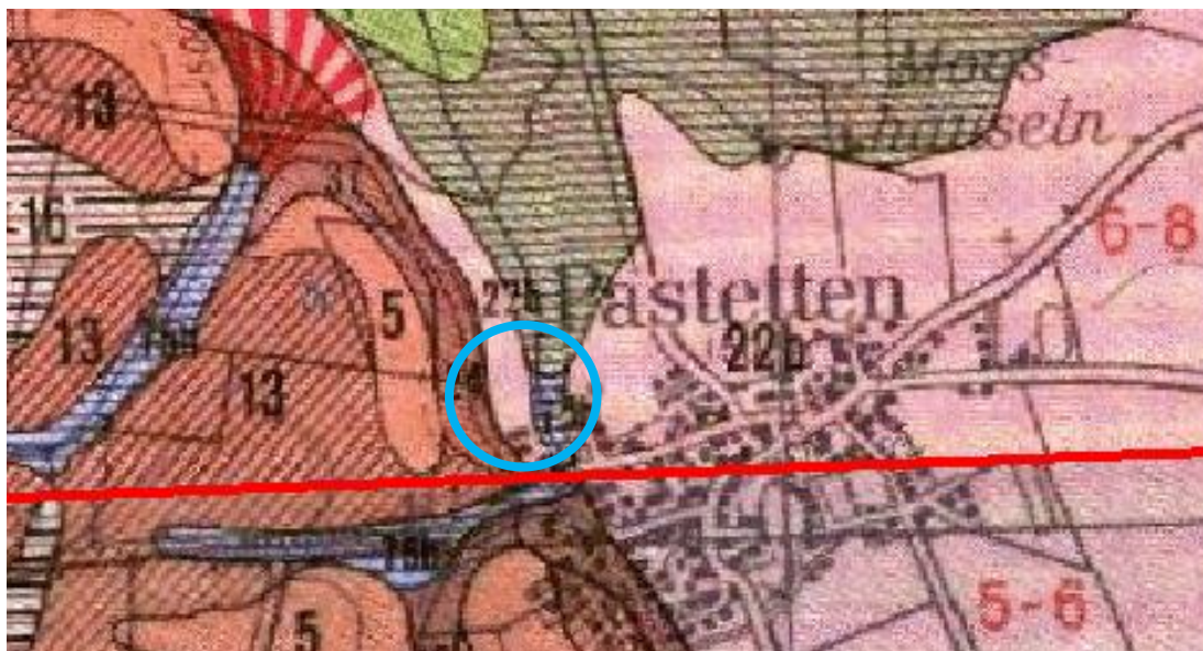
Abbildung 2: Ausschnitt Standortkundliche Bodenkarte 1:50.000, München-Augsburg Fachdaten: © Bayerisches Landesamt für Umwelt

Hintergrundkarten: © Bayerische Vermessungsverwaltung, Bundesamt für Kartographie und Geodäsie, Bayerisches Landesamt für Umwelt, GeoBasis-DE / BKG, EuroGeographics, CORINE Land Cover