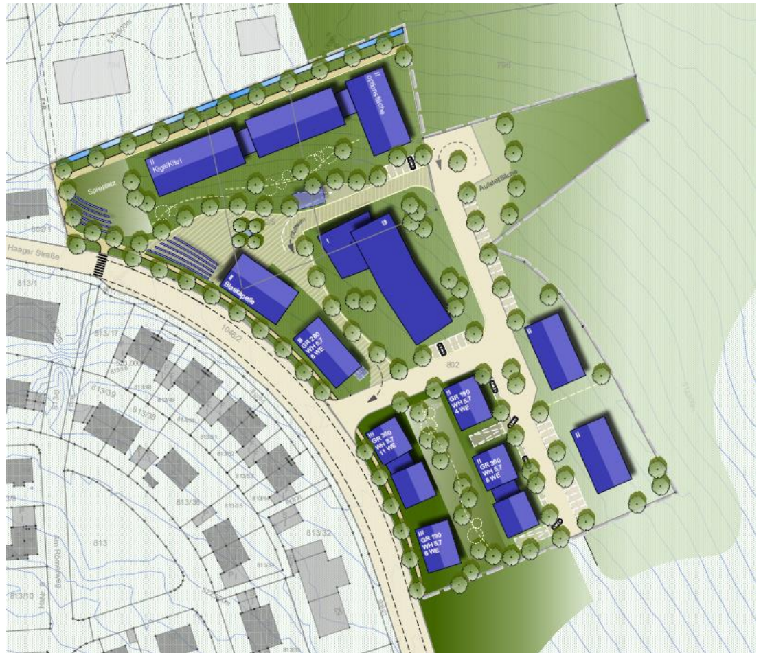
Abb. 3 Städtebaulicher Entwurf, PV München 15.04.2021, ohne Maßstab