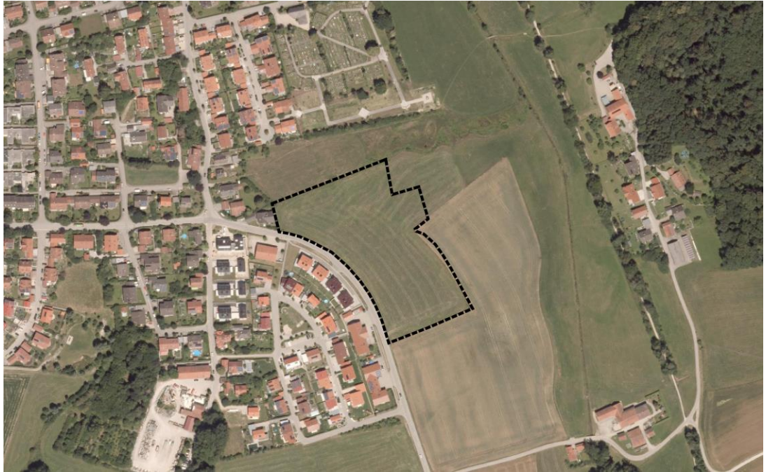
Abb. 1 Plangebiet, ohne Maßstab, © Bayerische Vermessungsverwaltung, 2018