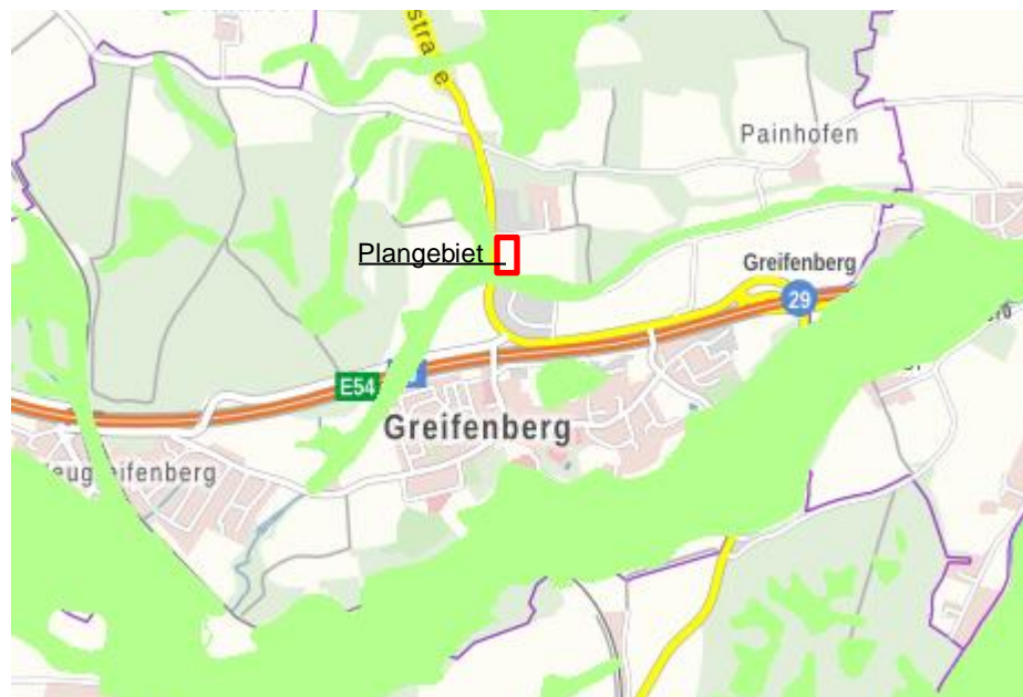
Abbildung 3: Luftbild mit wassersensiblen Bereichen (hellgrün dargestellt) entlang des Längenmoosgrabens und eigene Darstellung

Der Längenmoosgraben ist ein Gewässer 3. Ordnung und beginnt rund 500 m südwestlich als Entwässerungsgraben der dort vorhandenen, als Grünland genutzten, landwirtschaftlichen Flächen. Er verläuft dann direkt südlich des Plangebietes und mündet rund 2 km weiter östlich in die Windach.