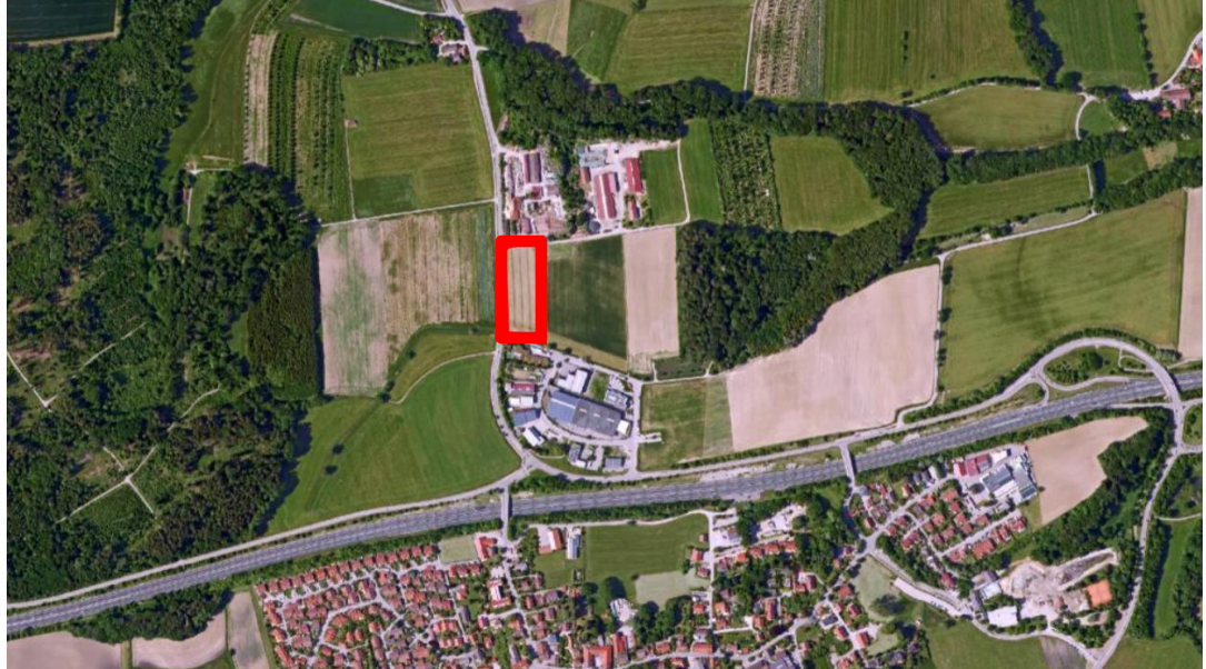
Abbildung 2: Plangebiet, ohne Maßstab, Quelle: Geobasisdaten© Bayerische Vermessungsverwaltung 2018, und eigene Bearbeitung

Das Gebiet der 10. Änderung liegt in der Gemeinde Greifenberg nördlich vom Hauptort Greifenberg und der Autobahn A 96. Es umfasst die Flurnummer 501, Gemarkung Greifenberg und weist eine Größe von ca. 1 ha auf.