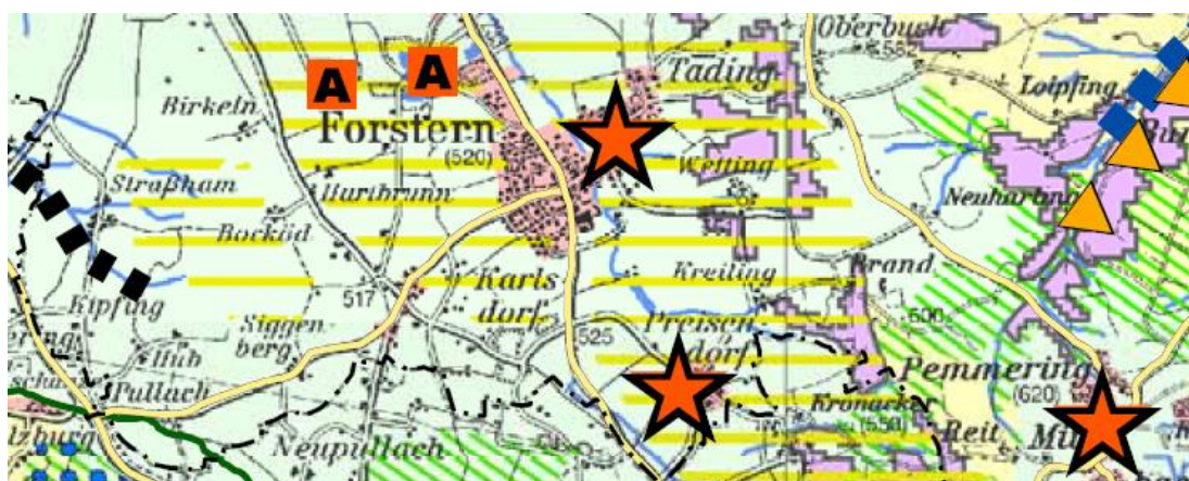
Ausschnitt aus der Leitbildkarte des Landschaftsentwicklungskonzeptes

Gemäß Landschaftsentwicklungskonzept handelt es sich bei der katholischen Pfarr- und Wallfahrtskirche Mariä Himmelfahrt in Tading und der katholischen Filialkirche St. Stefan in Preisendorf um erhaltenswerte Objekte mit besonderer kulturlandschaftlicher Bedeutung, deren Fernwirkung im Landschaftsbild sicherzustellen ist.